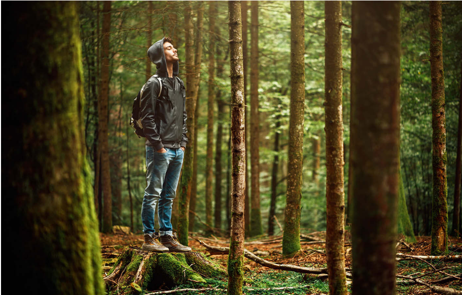
Abb. 3: Gestresste Menschen finden im Wald nicht nur mehr Ruhe, sondern genießen darüber hinaus gleich ein umfassendes Vorteils- und Regenerierungsprogramm.