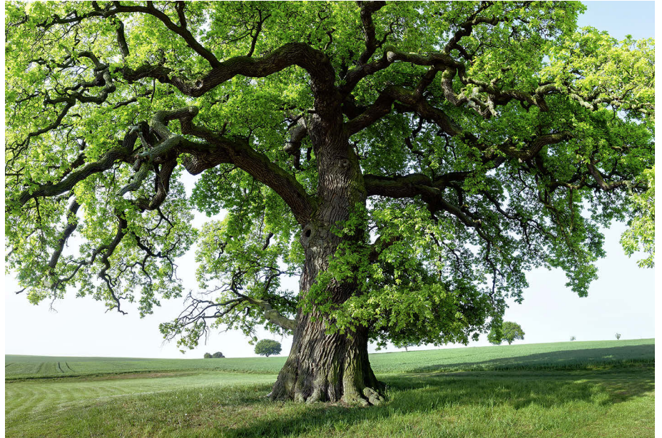
Abb. 1: Auch ein noch so kraftvoller Baum steht nur solange an der Lichtung, bis er eines Tages bricht.

Ähnlich wie der alten Eiche ergeht es weltweit immer mehr Menschen. Zwar liegt es hier selten am Wetter oder der Bodenbeschaffenheit, aber es finden sich auch im